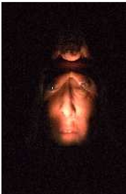
Inferno/proiezione di un volto sul corpo di un altro