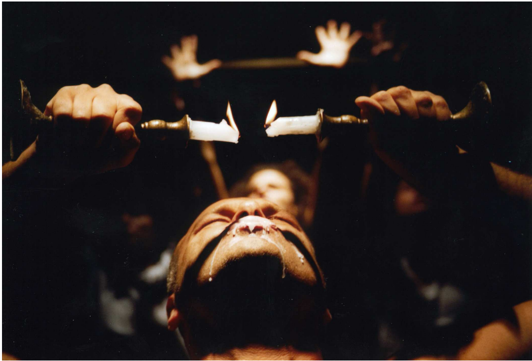
il sigillo di cera

improvvisamente un frutto o come nel rituale desco comune e condiviso che chiude questa e altre drammaturgie del Lemming. Lo stesso svilupparsi della drammaturgia in una sorta di cammino, di una peripezia all'interno dello spazio drammaturgico, sottratto come un cerchio magico alla schiavitù delle contingenze, tende a rappresentare concretamente, nello spostamento e anche nella fatica del muoversi ponderale del fisico, il segno della trasformazione.